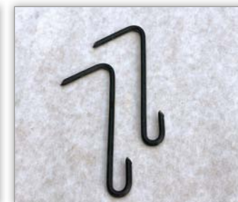
Leihaken B316 RVS