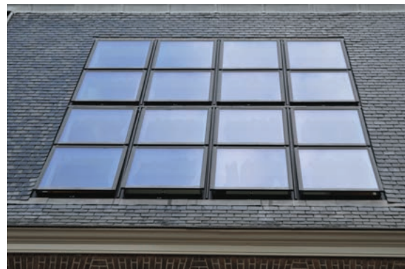
CAST PMR DAKRAMEN